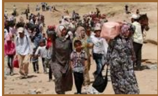
Refugiados que nos son reconocidos por las convenciones internacionales.

No es propio de habitantes de este planeta vivir cada vez más inundados de cemento, asfalto, vidrio y metales, privados del contacto físico con la naturaleza. Capítulo 1 – 4 – No. 44